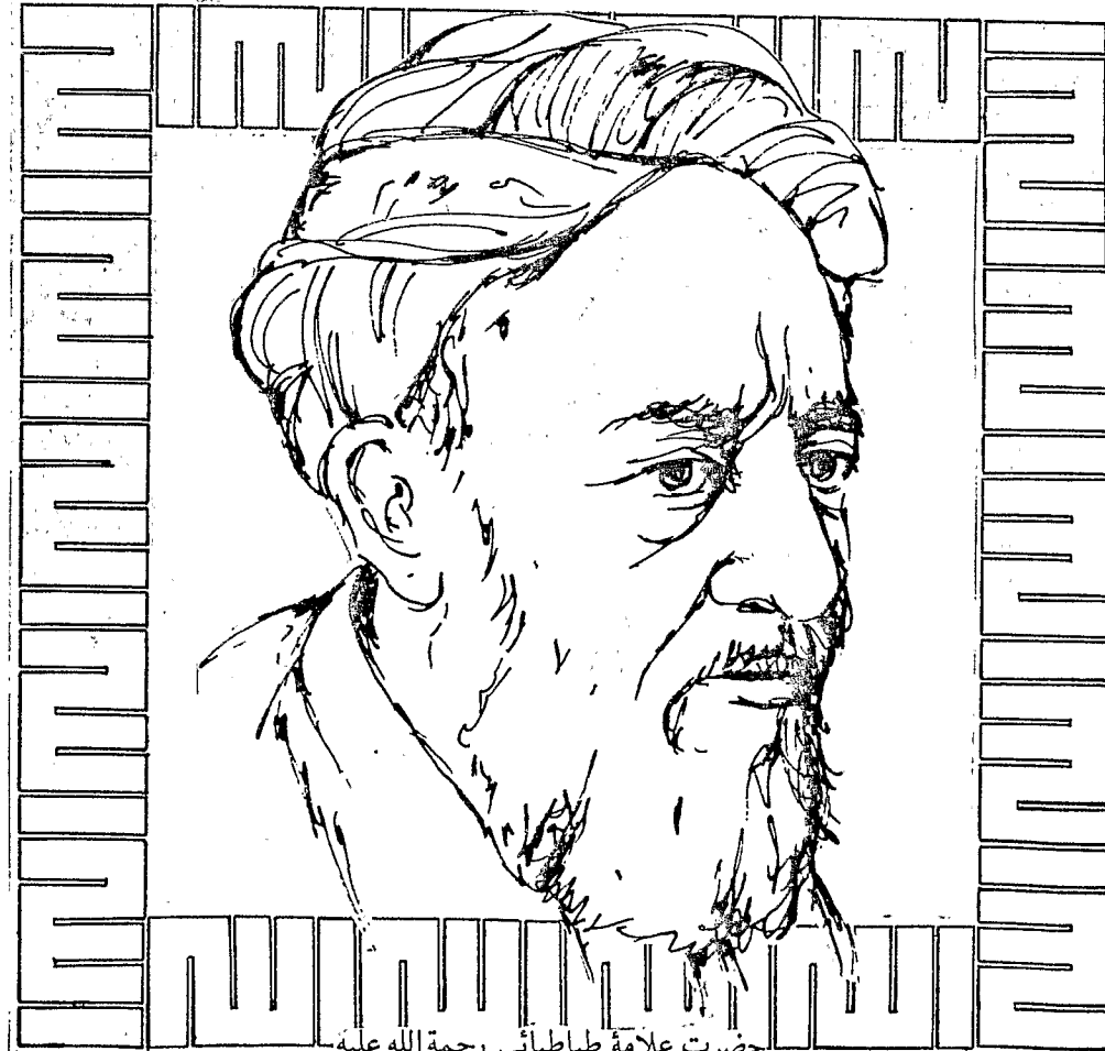
حضرت علامہ طباطبائی رحمۃ اللہ علیہ