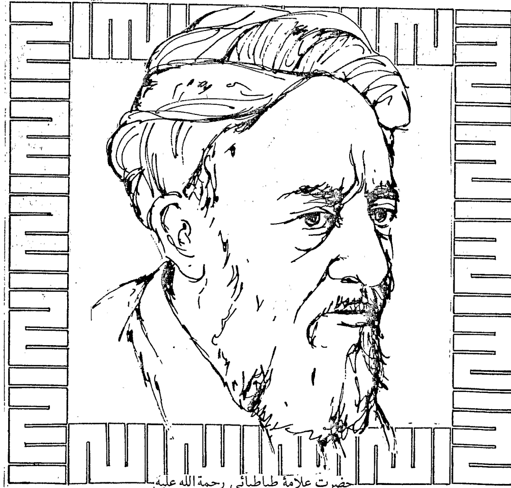
حضرت علامہ طباطبائی رحمۃ اللہ علیہ